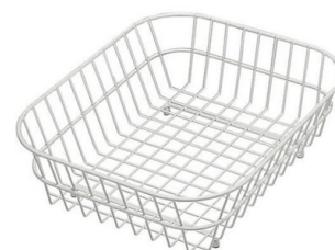
白篮 8612 100